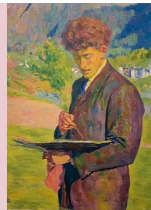
Alberto Giacometti, zelfportret, 1921.